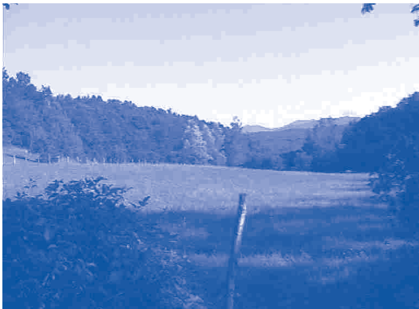
Una veduta della piana della Forana

possano rinascere, (parleremo nei prossimi numeri dell'interessante esempio di Bardi). Non abbiamo dimenticato che le nostre valli sono zone di forte emigrazione, Il Mio Paese ha anche lo scopo di informare chi non abita più qui, chi per esigenze di lavoro è dovuto emigrare. Anche in questo caso ci piacerebbe avere la collaborazione di chi questi temi li affronta già e che quindi ha più conoscenze specifiche di noi. E infine il perché del nome: come prima cosa perché è un titolo di testata che incarna l'attaccamento nostro al paese e poi perché è il titolo del libro del Sen. Primo Lagasi, bedoniese che visse nel nostro paese a cavallo dei due secoli e che scrisse questo libro con lo spirito con cui noi (più modestamente) ci accingiamo a pubblicare questo giornale.