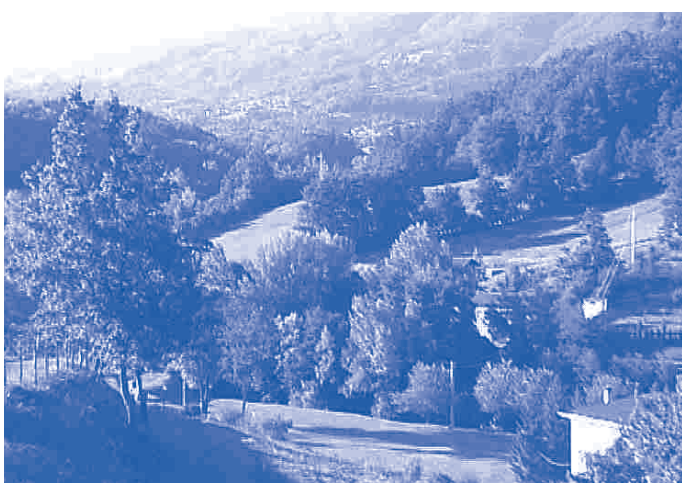
Una veduta della valle da cui partirebbe la strada di attraversamento della Forana